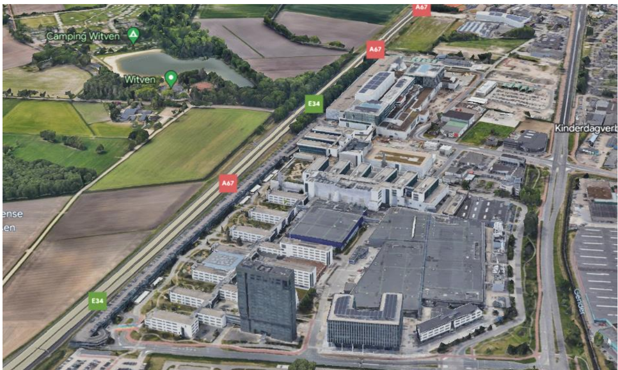
afbeelding : bestaand bedrijfsterrein ASML Run 6000/7000

In Veldhoven is het bedrijfsterrein van ASML aan de Run 6000/7000 gelegen, zoals op onderstaande afbeelding weergegeven.