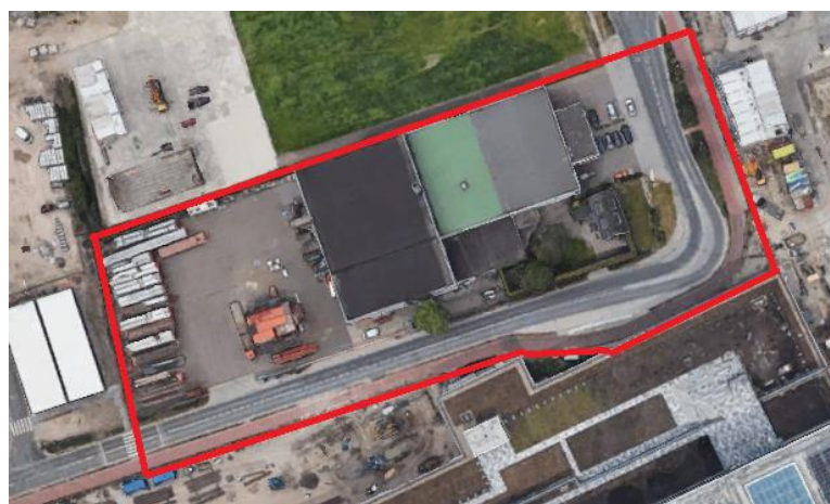
afbeelding : oostelijk plandeel