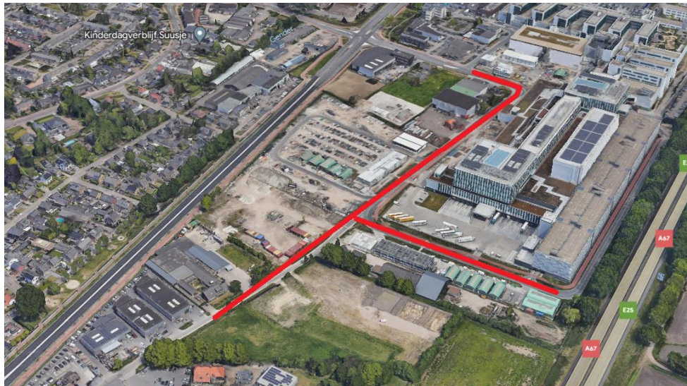
afbeelding : het te bestemmen weggedeelte Heiberg / de Run