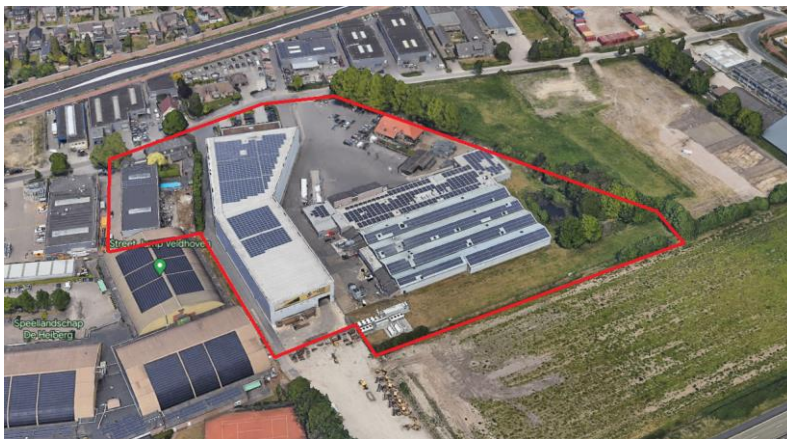
afbeelding : westelijk deel plandeel

De locatie bestaat uit een drietal onderdelen, het westelijk deel (drie percelen) en het oostelijk deel (een perceel) met hierbij delen van de tussenliggende openbare weg (Heiberg / De Run) alsmede aanpassing van enkele bouwvlakken en bouwhoogten van aangrenzende bestemmingsplannen (om tot een aaneengesloten te bebouwen gedeelte te kunnen komen).