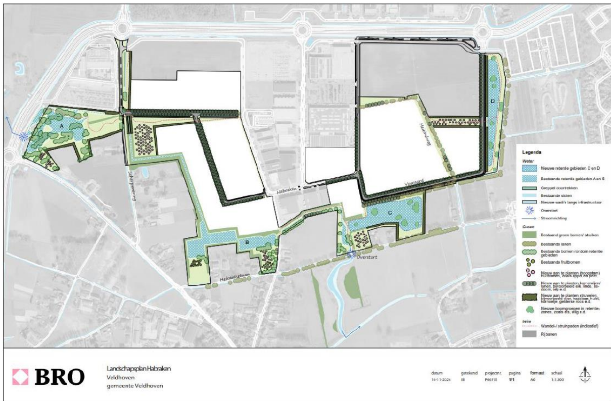
Figuur 7. De toekomstige landschappelijke inpassing en waterberging rondom het nieuwe bedrijventerrein.