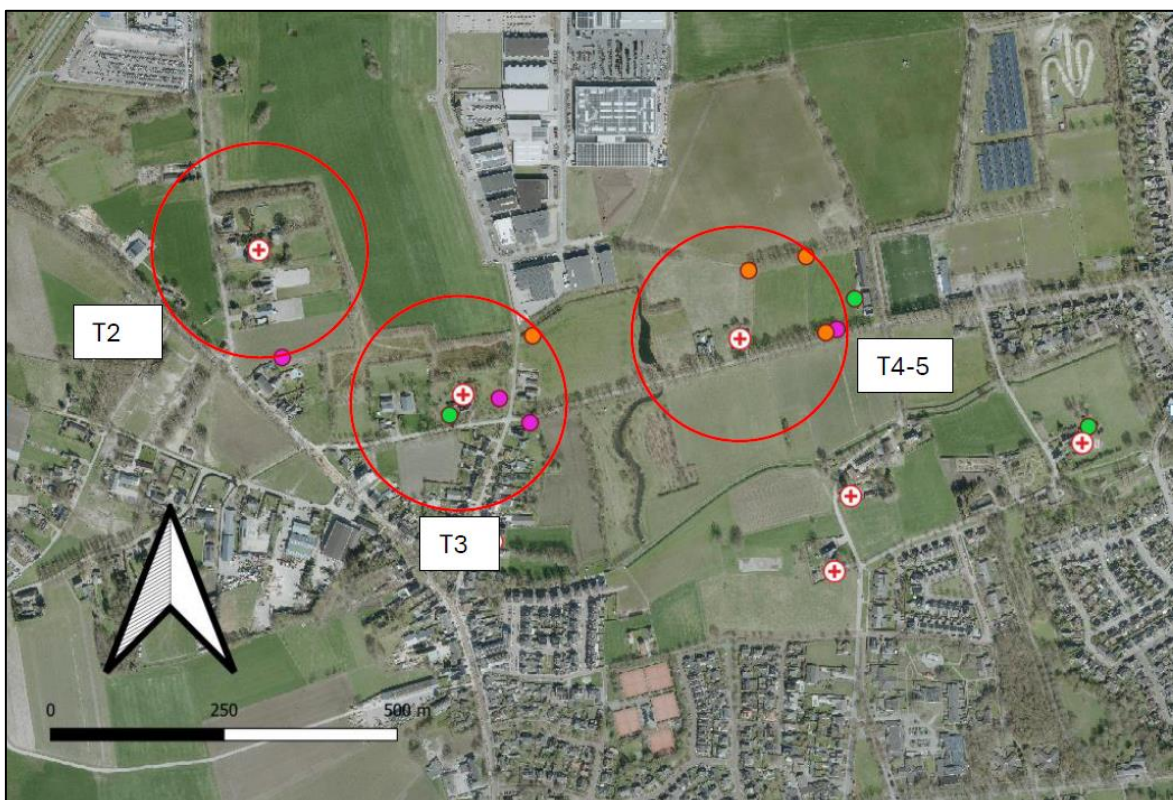
Figuur 2. Locaties van de waargenomen steenuilen, gedurende de drie bezoeken in 2022. De kleuren indiceren de verschillende onderzoeks rondes. Met de rode cirkels worden de afzonderlijke territoria aangeduid, binnen de invloedssfeer van het nieuw te ontwikkelen bedrijventerrein. Tevens worden de desbetreffende territoria aangeduid in het tekstvak.