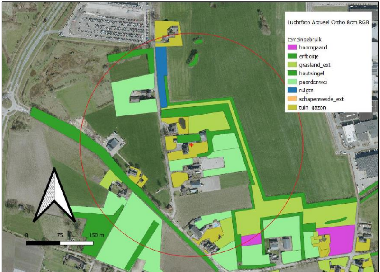
Figuur 3. Overzicht van de interessante ecotopen voor steenuilen in T2.