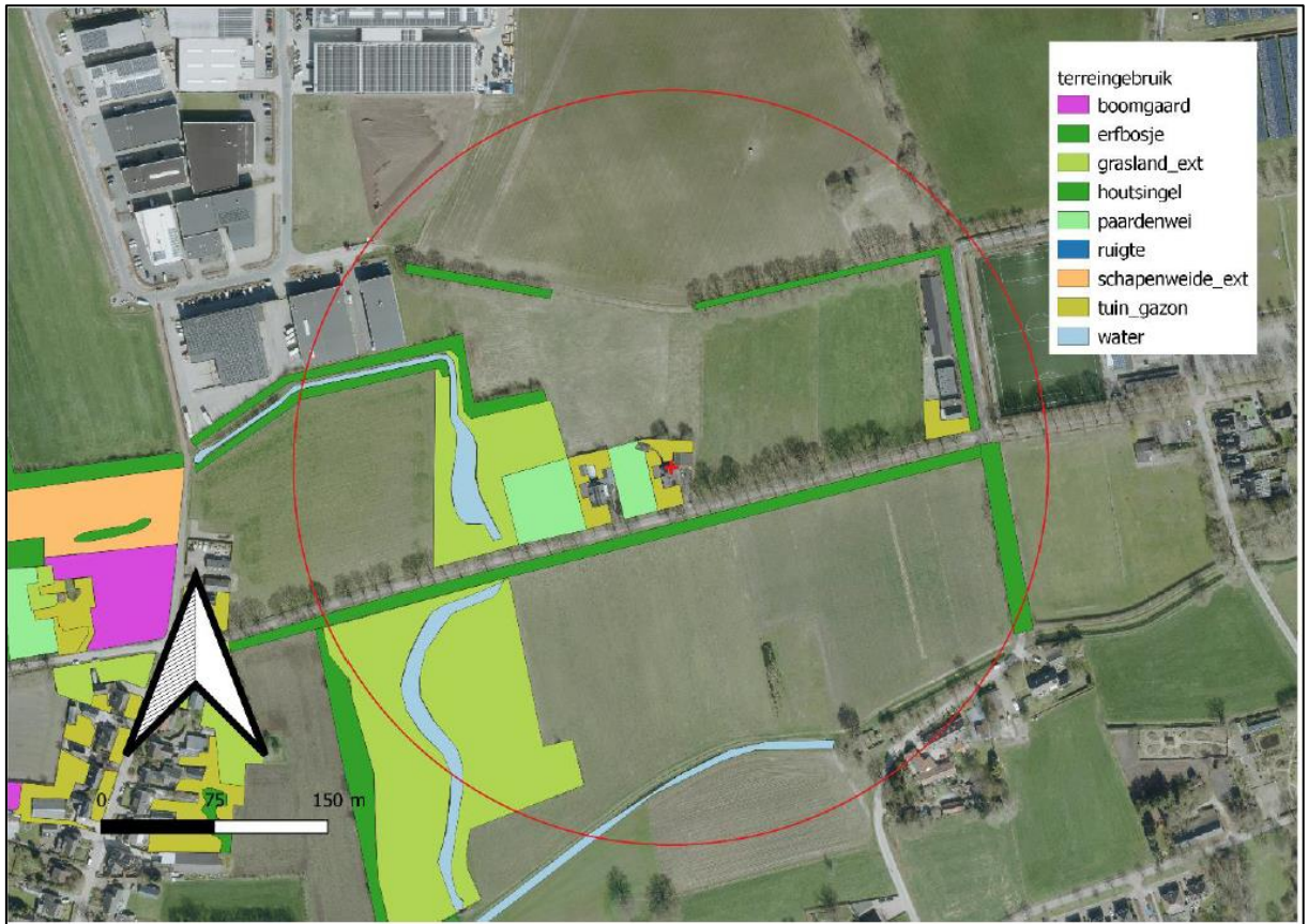
Figuur 5. Overzicht van de interessante ecotopen voor steenuilen in T4-5.