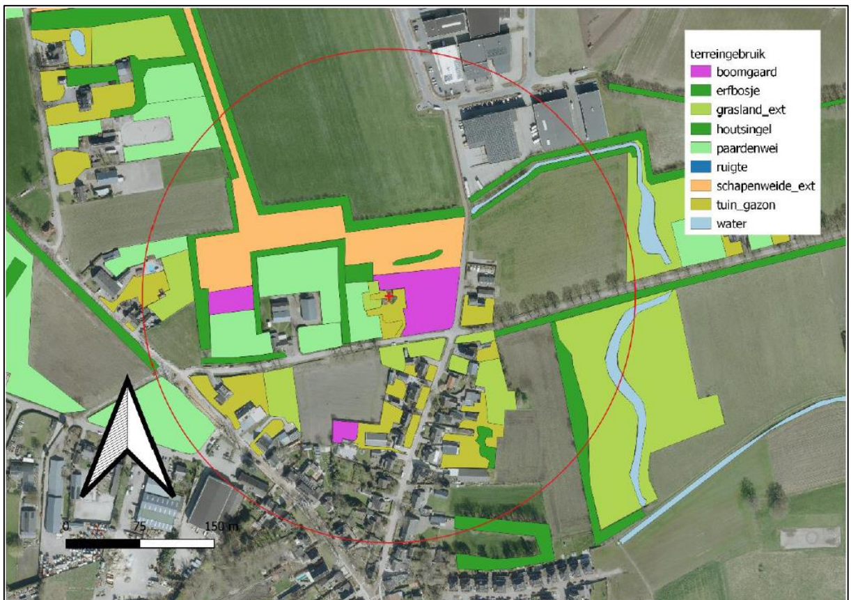
Figuur 4. Overzicht van de interessante ecotopen voor steenuilen in T3.