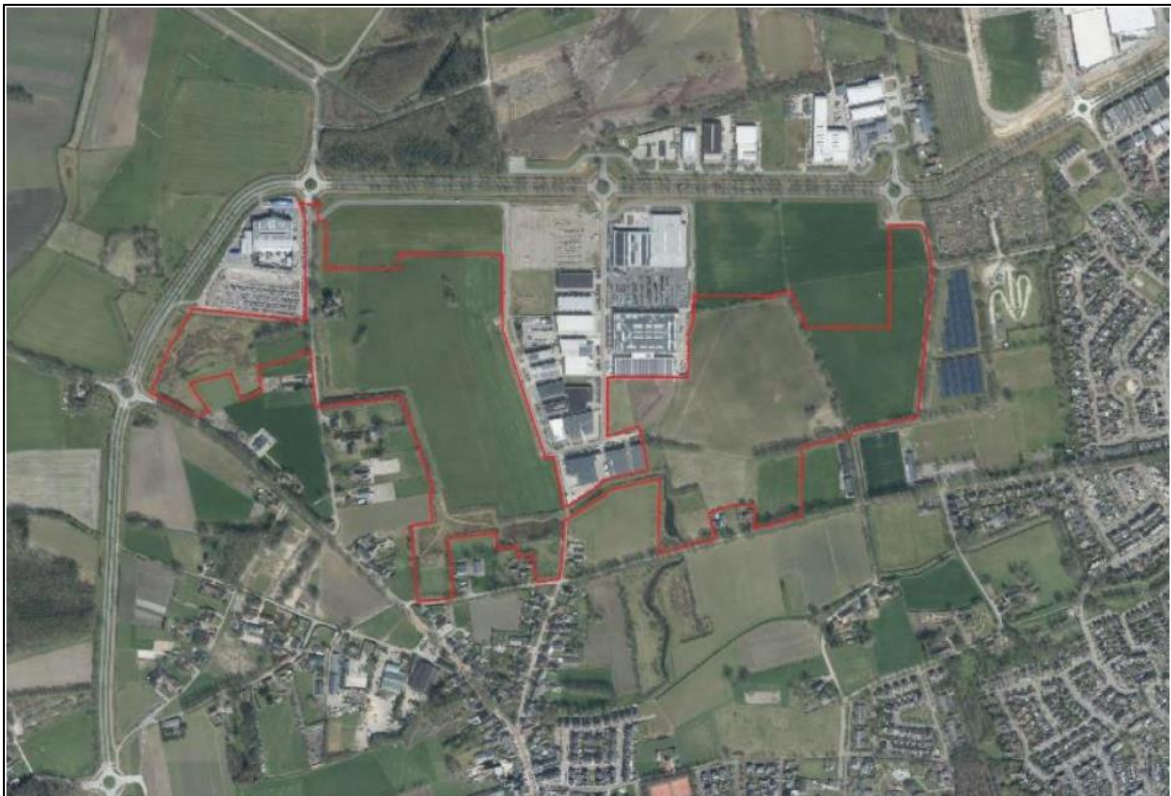
Figuur 1. Locatie Habraken te Veldhoven. De activiteiten vinden plaats binnen het omliggende gebied.