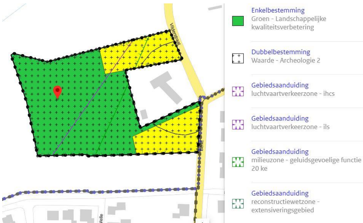
Afbeelding 2: verbeelding ontwerpbestemmingsplan 'Vilderstraat'

Afbeeldingen 2 en 3 tonen de verbeelding voor en na de doorgevoerde wijzigingen.