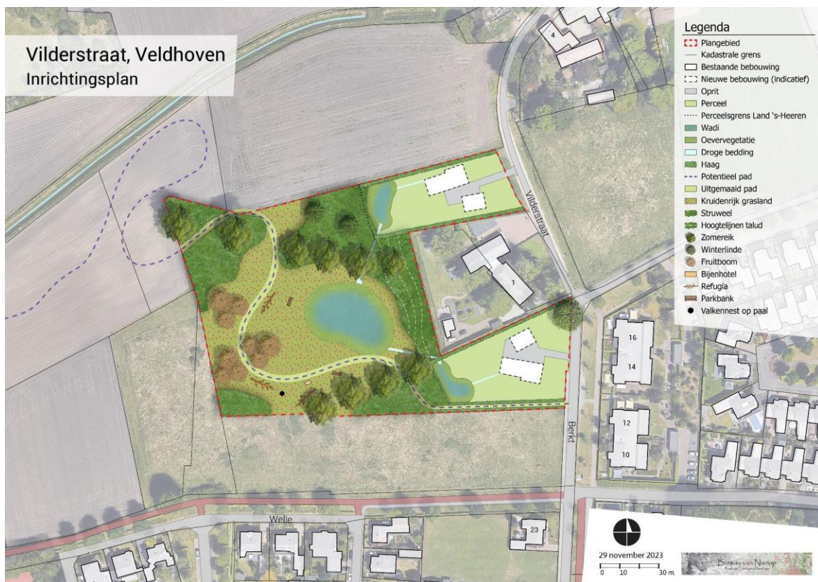
Afbeelding 1: Inrichtingsplan Vilderstraat te Veldhoven

b. Het vastgestelde bestemmingsplan bevat naast een toelichting op de verplichte kwaliteitsverbetering ook een inpassingsplan (deze is tevens verwerkt in bijlage 'Inrichtingsplan Vilderstraat te Veldhoven' bij het bestemmingsplan), waarin verschillende maatregelen ten behoeve van de inpassing van beide woningen die plaatsvinden binnen het woonperceel worden toegelicht. Er wordt een voorwaardelijke verplichting in de regels opgenomen opgenomen die borgt dat zowel de kwaliteitsverbetering als de inpassing wordt aangelegd en in stand wordt gehouden. Afbeelding 1 toont de inrichtingstekening van de manier waarop de landschappelijke kwaliteitsverbetering wordt ingevuld.