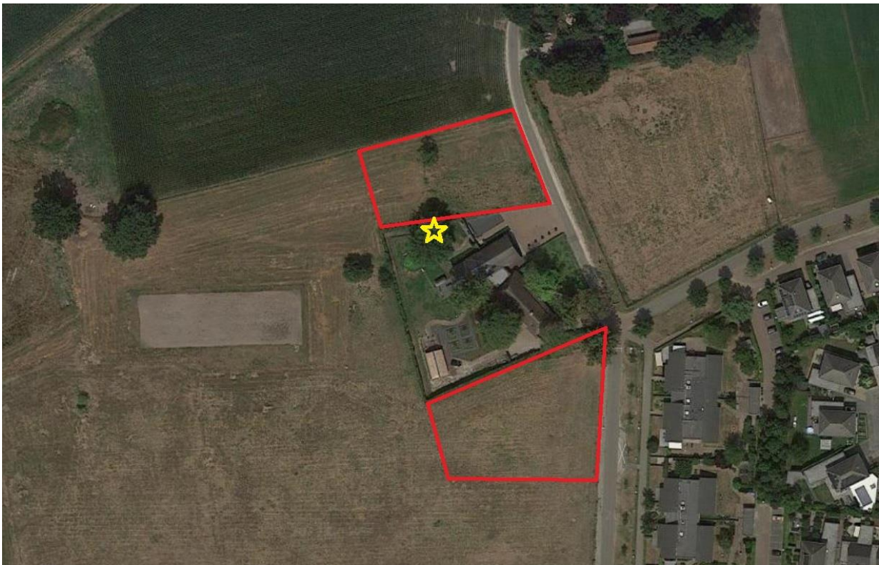
Figuur 4.5.1. Locatie van de steenuilennestkast (gele ster) direct aangrenzend aan het plangebied (rood omlijnd).

In de tuin van Vilderstraat 1 (het plangebied grenst aan twee zijden aan dit terrein) hangt één steenuilennestkast (zie figuren 4.5.1 en 4.5.2). De omgeving is voornamelijk agrarisch ingericht, met paardenweitjes en enkele bomenrijen (resp. foerageergebied en schuilplaats). Dergelijke biotopen vormen volgens BIJ12 (2017) een zeer geschikte steenuilenhabitat. De bewoner van deze woning gaf aan niet te weten of er jaarlijks een steenuil in de steenuilennestkast broedt. Hij neemt geen geluiden van (jonge) steenuilen waar. Uit navraag aan Steenuilenwerkgroep De Goei Kast (die de betreffende steenuilennestkast jaarlijks controleren en beheren) blijkt dat er de laatste jaren geen bewoning en geen broedresultaat door steenuilen heeft plaatsgevonden (pers. comm. Hennie Spitters en Cor Verheijden). Er is dus geen sprake van een steenuilennest dan wel -roestplaats.