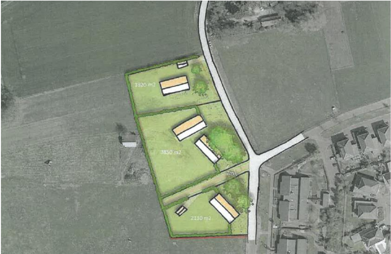
Figuur 3.1. De voorgestane inrichting.

In het plangebied worden twee woningen gerealiseerd. Hiervoor wordt de bestaande vegetatie verwijderd. De voorgestane situatie is weergegeven in figuur 3.1.