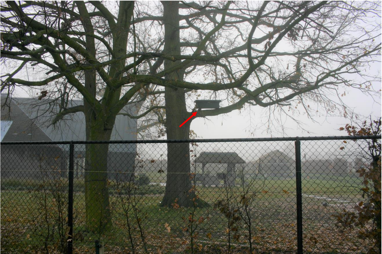
Figuur 4.5.2. Steenuilennestkast (zie rode pijl) in de tuin van Vilderstraat 1.