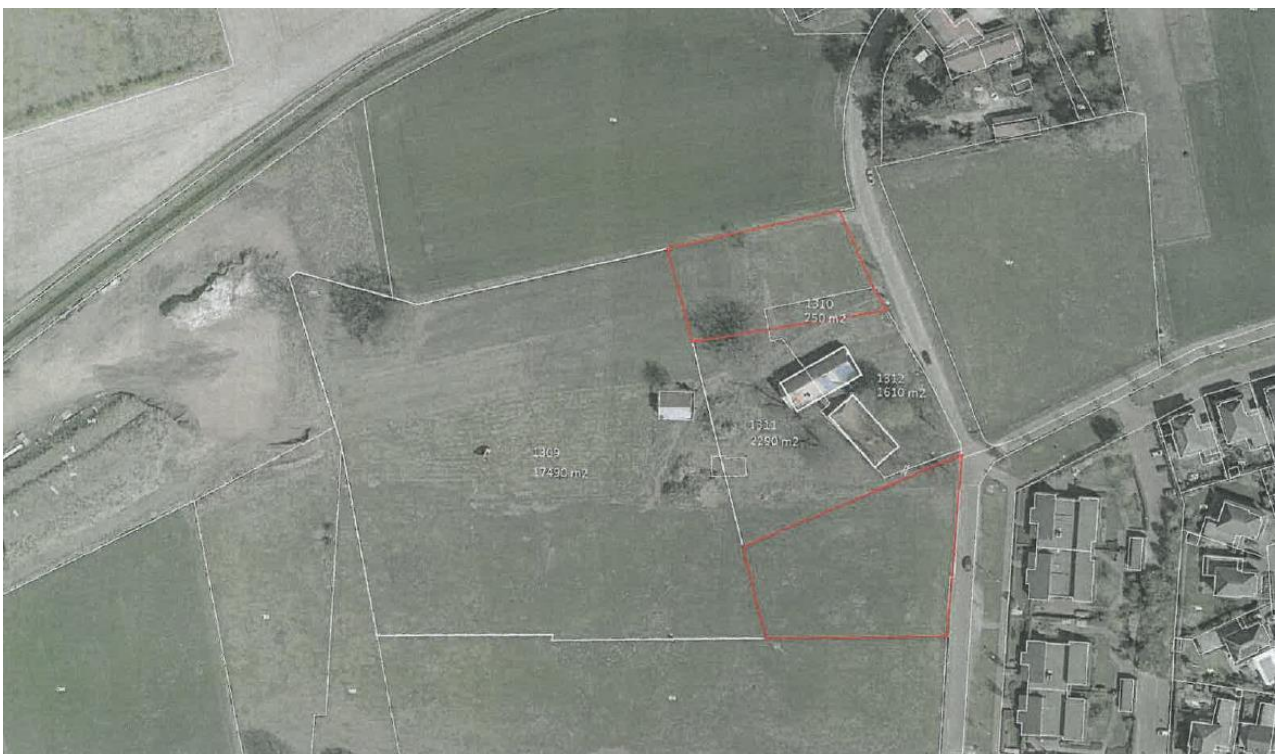
Figuur 4.1. Luchtfoto van het plangebied (rood omlijnd).

Het plangebied (zie figuur 1.1 en de foto's op de voorzijde van het rapport) ligt in het noordwesten van Veldhoven, binnen de bebouwde kom. Het bestaat feitelijk uit twee deelgebieden (zie figuur 1.1). Aan de zuidoostzijde wordt het plangebied begrensd door een woonwijk. De overige zijdes grenzen aan weilanden. Het plangebied zelf fungeert momenteel als weiland. In het plangebied bevinden zich geen gebouwen. In het plangebied komen soorten voor als kamille, akkerdistel, bijvoet, ridderzuring, kruipende boterbloem, speerdistel, kaasjeskruid, gestreepte witbol, vogelmuur, kropaar, witte dovenetel en jacobskruiskruid.