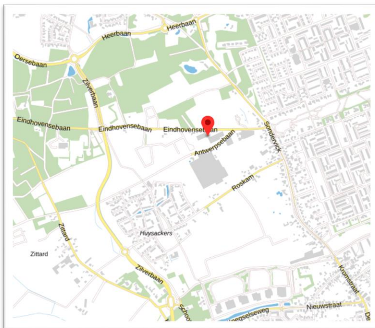
Afbeelding 1: huidige locatie Boss Machinery aan de Eindhovensebaan

Het bedrijf Boss Machinery is gevestigd aan de Eindhovensebaan. Voor de woningbouwontwikkeling van het Kransackerdorp is het noodzakelijk dat het bedrijf verplaatst wordt. Het bedrijf zal verplaatst worden naar Habraken, waar in mei 2023 de benodigde overeenkomsten voor zijn ondertekend. In onderstaande afbeeldingen zijn de huidige en de toekomstige locatie van het bedrijf bij de rode punten weergegeven.