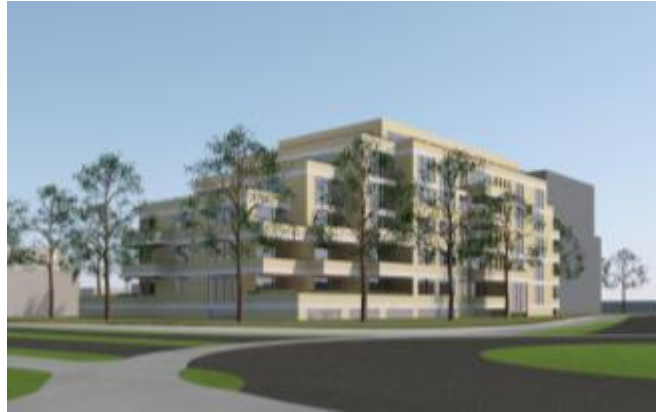
afbeelding : project (blok A)

Onderstaande afbeeldingen vormen een weergave van het project. Het gaat om de bouw van maximaal 96 nieuwe gestapelde woningen in twee gebouwen in het plangebied.