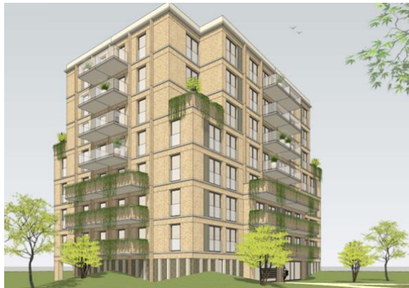
afbeelding : project (Blok B)