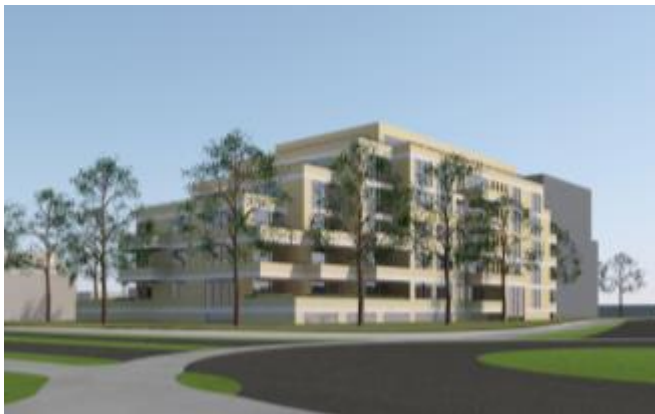
afbeelding : project (blok A)

Het project bestaat uit de vervanging van een kantoorpand van Zuidzorg aan de Dorpsstraat door een complex woningen alsmede de nieuwbouw van een tweede wooncomplex aan de Run, tezamen omvattende 96 woningen Dit ontwikkelingsplan geeft aanleiding om voor het plangebied te komen tot een nieuw bestemmingsplankader.