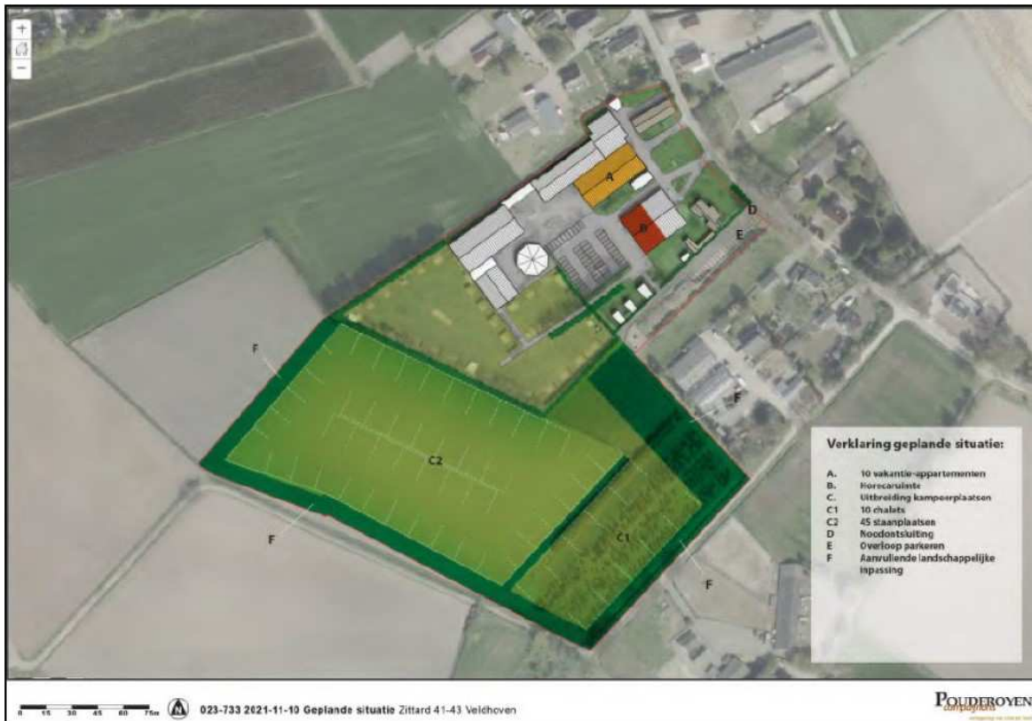
Afbeelding 3 Geplande situatie

De geplande situatie is weergegeven in afbeelding 3.