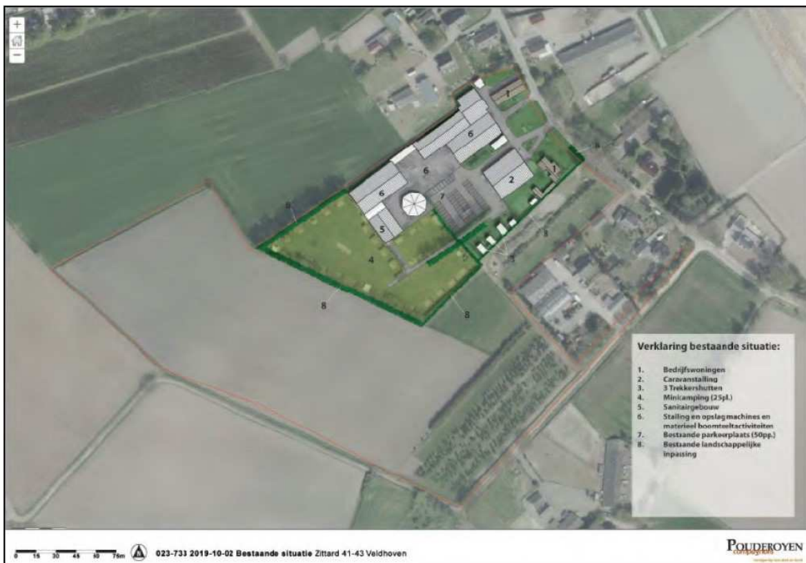
Afbeelding 2 Huidige situatie

De bestaande situatie is weergegeven in afbeelding 2.