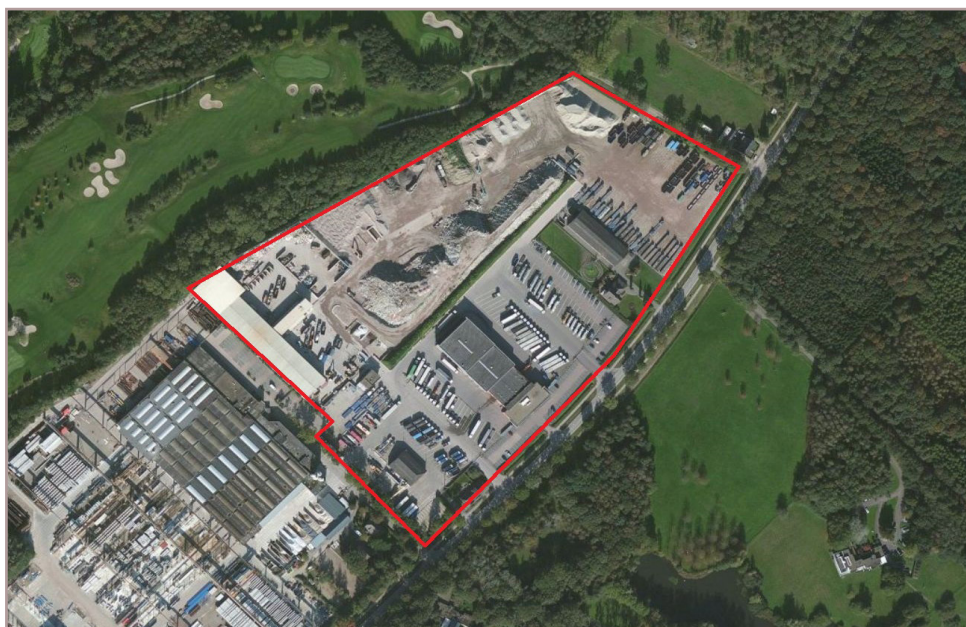
Figuur 1 Globale be- grenzing van het plangebied (rood).

Het plangebied Baetsen Locht 100 is gelegen ten zuidwesten van Veldhoven en maakt onder-