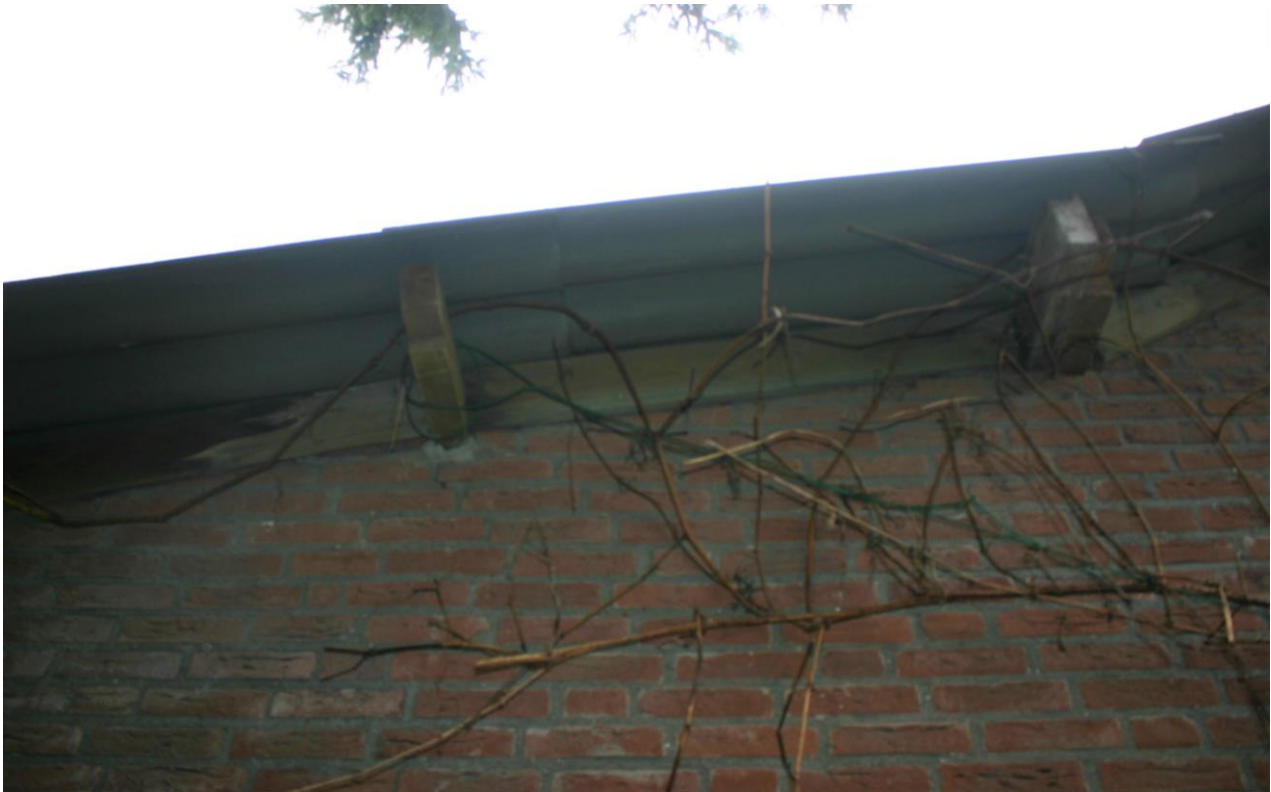
Figuur 4.4.1. Openingen onder de golfplaten op de halfopen veldschuur zijn afgewerkt met houten latten.

De volgende vogelsoorten zijn tijdens het veldbezoek in het plangebied waargenomen: koolmees, grote bonte specht, vink, roodborst en huismus. In het plangebied bevinden zich twee gebouwen. In het zuiden bevindt zich een halfopen veldschuur (zie grote foto voorzijde rapport). Deze heeft spouwmuren en een enkelwandig golfplaten dak. Een dakgoot ontbreekt, waardoor huismussen niet kunnen landen om onder het dak te kruipen. Op de kopse kanten zijn de ingangen onder de golfplaten afgedicht met een houten lat (zie figuur 4.4.1). Overige holtes zijn niet aanwezig, waardoor het gebouw ongeschikt is voor gierzwaluwnesten. De binnenzijde van de veldschuur is volledig geïnspecteerd. Tijdens het veldbezoek zijn nergens nesten, poepstrepen, braakballen etc. waargenomen.