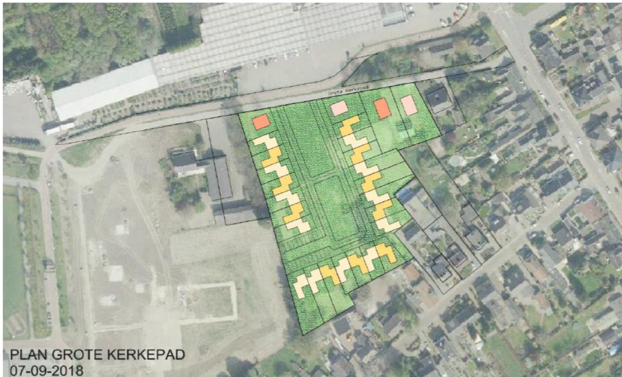
Figuur 3.1. De voorgestane situatie.

Het plangebied wordt omgevormd tot woonwijk. Hiervoor wordt de bestaande vegetatie verwijderd. Daarna worden er nieuwbouw woningen gebouwd; 22 levensloop bestendige woningen en 4 vrijstaande woningen (zie figuur 3.1). Ook wordt er een parkeergelegenheid aangelegd.