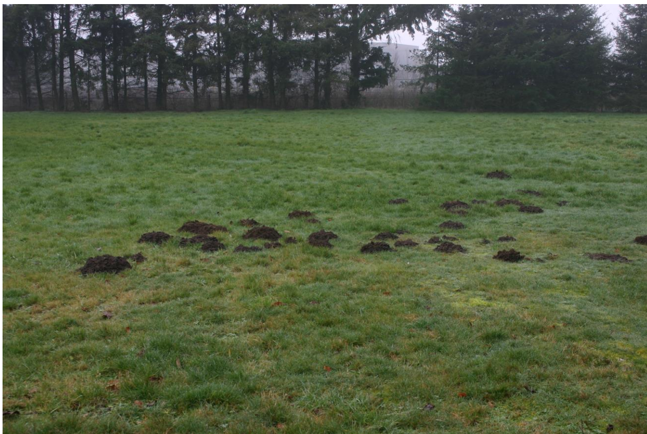
Figuur 4.4.2. Molshopen in het zuidelijke deel van het plangebied.