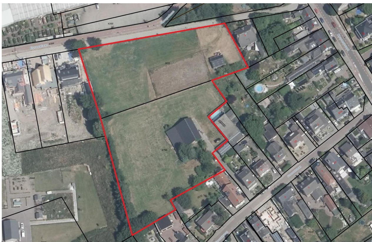
Figuur 4.1. Luchtfoto van het plangebied (rood omlijnd).

Het plangebied bestaat uit twee delen (gescheiden door de zwarte lijn in figuur 4.1); het noordelijke deel fungeert momenteel als paardenwei en het zuidelijke deel als achtertuin. In de paardenwei bevinden zich paardenstallen (paarden waren afwezig tijdens het veldbezoek). In het zuidelijke deel van het plangebied bevindt zich nog een gebouw; een half open veldschuur. In het plangebied is voornamelijk gazon aanwezig, met soorten als paardenbloem, smalle weegbree, paarse dovenetel, yucca, kruipende boterbloem, conifeer, winterpostelein, klimop, rododendron, hondsdrif, gewoon duizendblad, vogelmuur, notenboom, kers, Japanse kers, fijnspar, hulst, biggenkruid, witte dovenetel, bamboe, grote brandnetel, braam, ridderzuring, melganzenvoet en taxus.