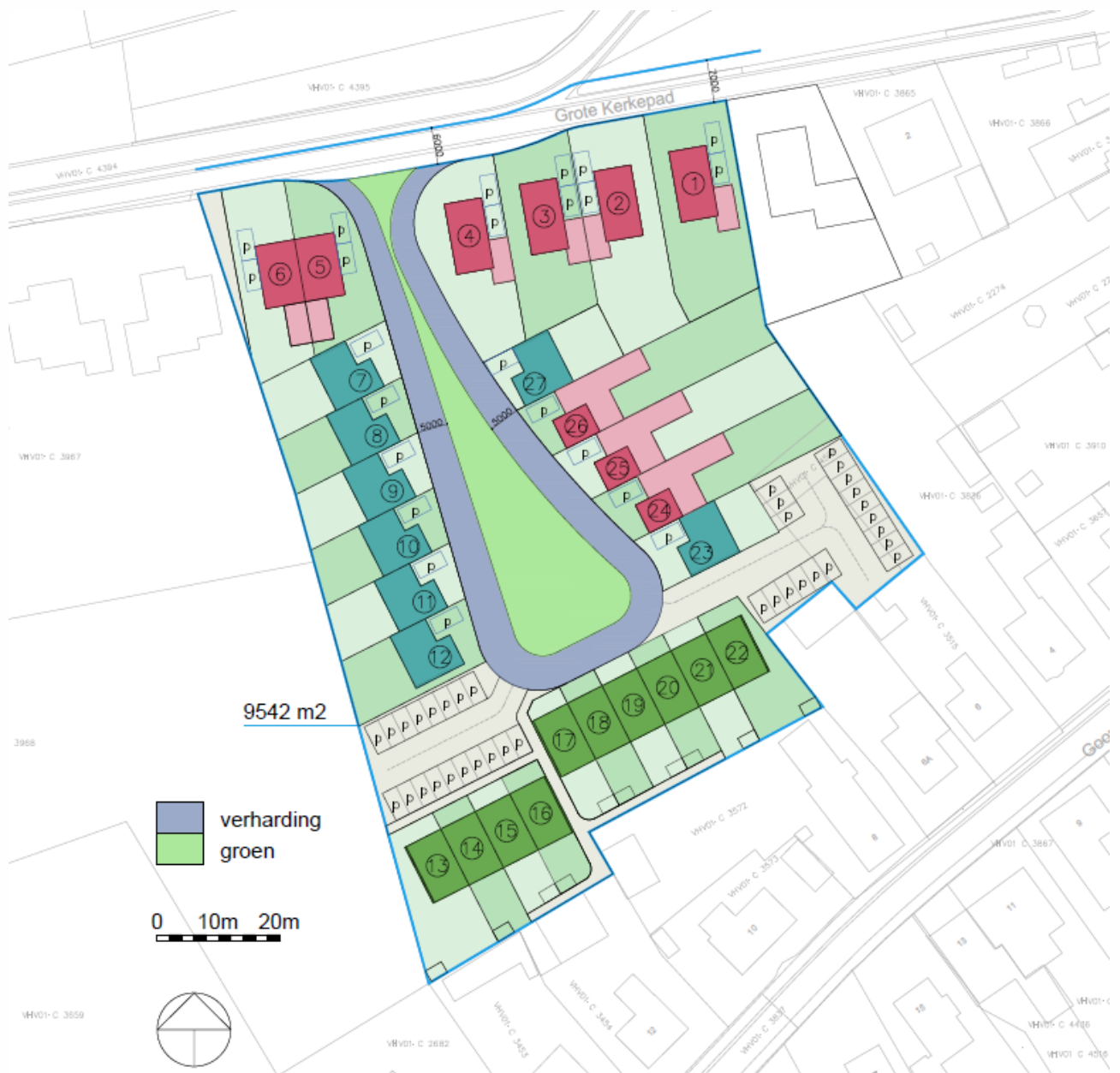
Figuur 3.1. Schets van de voorgestane situatie.

De bestaande vegetatie, gebouwen en het zwembad worden verwijderd. Vervolgens wordt er een woonwijk gerealiseerd (zie figuur 3.1).