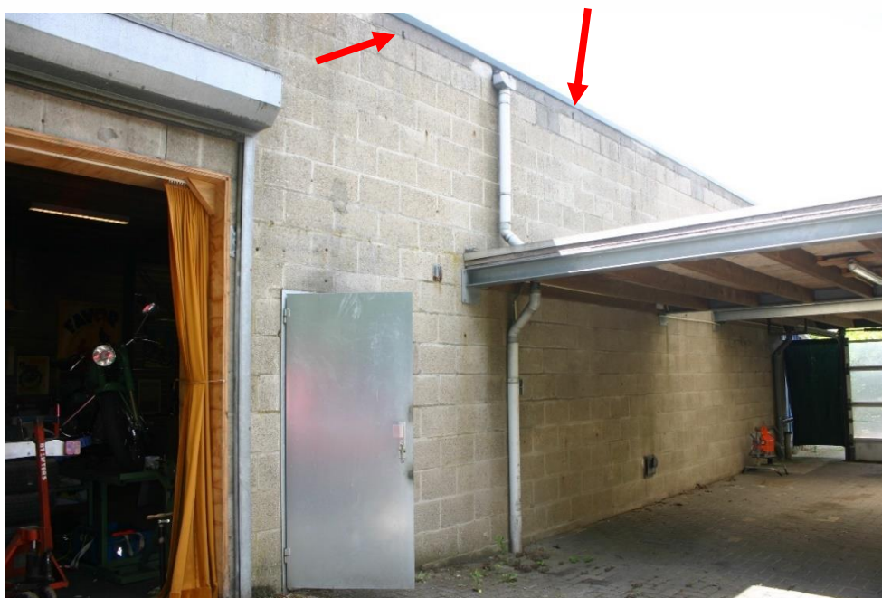
Figuur 4.4.2. Gebouw 2 (in figuur 4.1.1) heeft verschillende openingen die toegang geven tot de spouw (rode pijlen).

De buitengevels van de loods (2 in figuur 4.1.1) bestaan uit metselwerk en de binnengevels uit hout. De tussenliggende spouwen zijn grotendeels gevuld met steen- of glaswol, maar net onder het dak bevinden zich langgerekte holle ruimten. Deze zijn van buitenaf door vleermuizen te bereiken via meerdere open stootvoegen (zie figuur 4.4.2). In dit gebouw kunnen dus vleermuisverblijven aanwezig zijn. In het gebouw zelf zijn geen uitwerpselen etc. aanwezig en het gebouw is voorzien van een plat dak. Huismus- en gierzwaluwnesten, steenmarterverblijven etc. zijn in het gebouw dus afwezig.