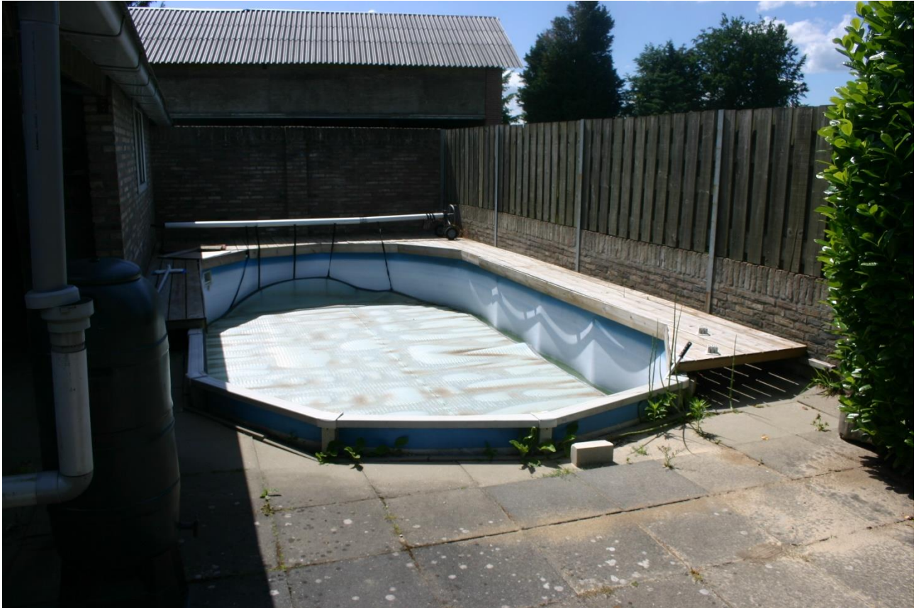
Figuur 4.1.2. Het zwembad achter Goorstraat 6.