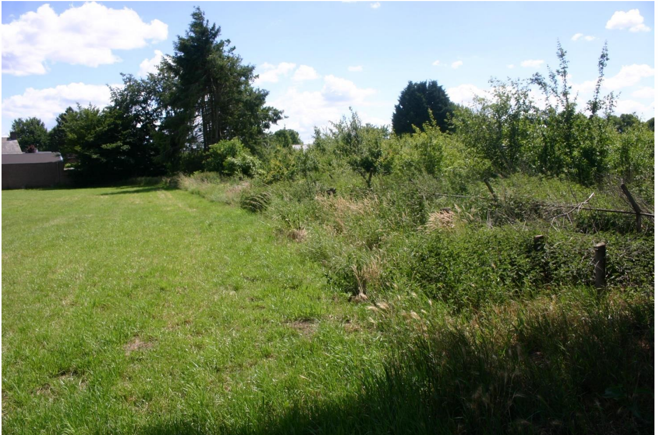
Figuur 4.4.3. De houtsingel op de westgrens van het plangebied is te laag om een belangrijke functie voor vleermuizen te vervullen.

Holle bomen zijn ook afwezig; het is daarom uitgesloten dat er echte vleermuisverblijven (of uilennesten etc.) elders in het plangebied aanwezig zijn. Ook rondom het plangebied zijn (in een straal van 100 meter) geen uilen- of roofvogelnesten aanwezig. Op de westgrens van het plangebied bevindt zich een houtsingel met enkele bomen (o.a. Servische spar) en meerdere struiken (zie figuur 4.4.3). Deze zijn te laag om als vliegroutes of belangrijk foerageergebied van vleermuizen te dienen. Tijdens het veldbezoek werden zwartkop, merel, tjiftjaf en houtduif in het plangebied waargenomen. Waarschijnlijk broeden er in het broedseizoen wel algemeen voorkomende vogels zoals de merel in de opgaande vegetaties in het plangebied.