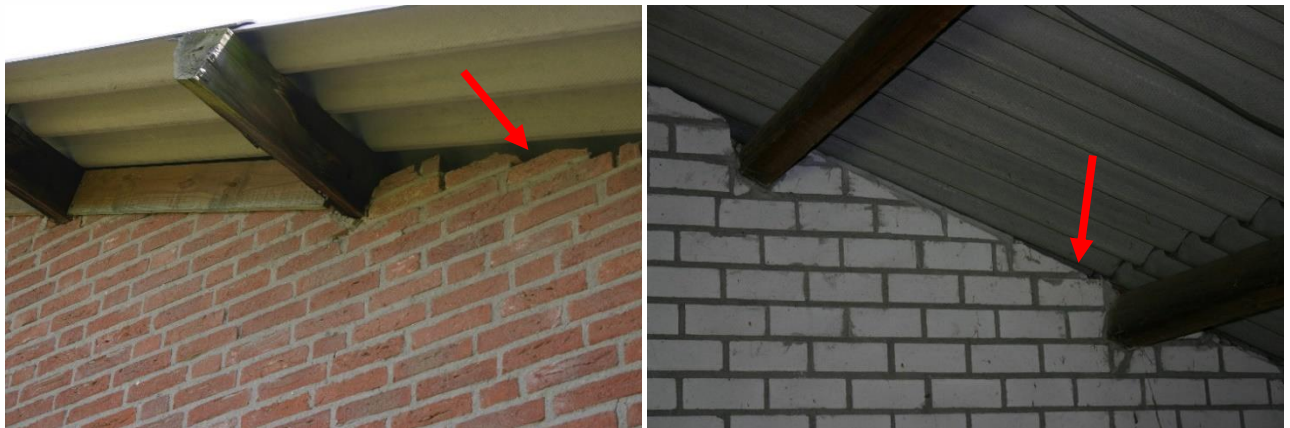
Figuur 4.4.1. Gebouw 1 (in figuur 4.1.1) heeft verschillende openingen die toegang geven tot de spouw (rode pijlen).

De grote schuur (1 in figuur 4.1.1) heeft een enkelwandig dak en in de schuur zijn nergens braakballen of uitwerpselen van vogels (als uilen) of steenmarters aangetroffen. Huismus- en gierzwaluwnesten of andere vogelnesten, steenmarterverblijven of een roestplaats van een steenuil of kerkuil zijn in dit gebouw dus afwezig. De gevels hebben spouw en op verschillende plekken zijn de spouwen van boven af open. Vleermuizen kunnen hier naar binnen (zie figuur 4.4.1). Het is dus mogelijk dat gebouw 1 vleermuisverblijven bevat.