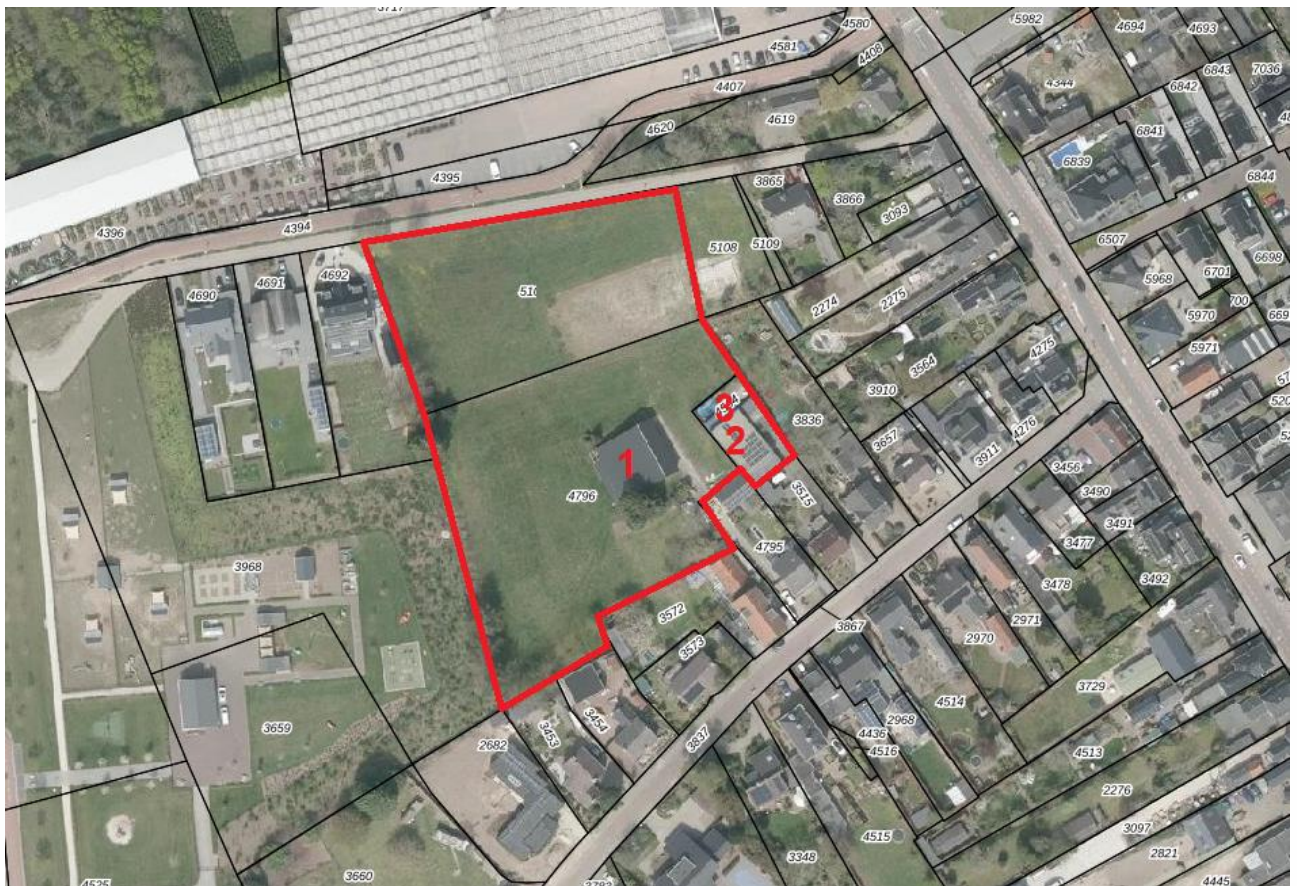
Figuur 4.1.1. Het plangebied (rood omlijnd). 1 = Grote schuur achter Goorstraat 6a, 2 = loods achter Goorstraat 6, 3 = Zwembad achter Goorstraat 6.

Het plangebied bestaat grotendeels uit een weiland (zie foto linksboven op pagina 2), met een daarin gelegen grote schuur (zie foto rechtsonder op pagina 2), een zwembad (zie figuur 4.1.2) en een loods (zie grote foto op pagina 2). In het weiland groeien diverse grassen en soorten als duizendblad, witte klaver en grote brandnetel, en enkele groepjes bomen en struiken (Servische spar, Chamaecyparis, hazelaar en roddendron).