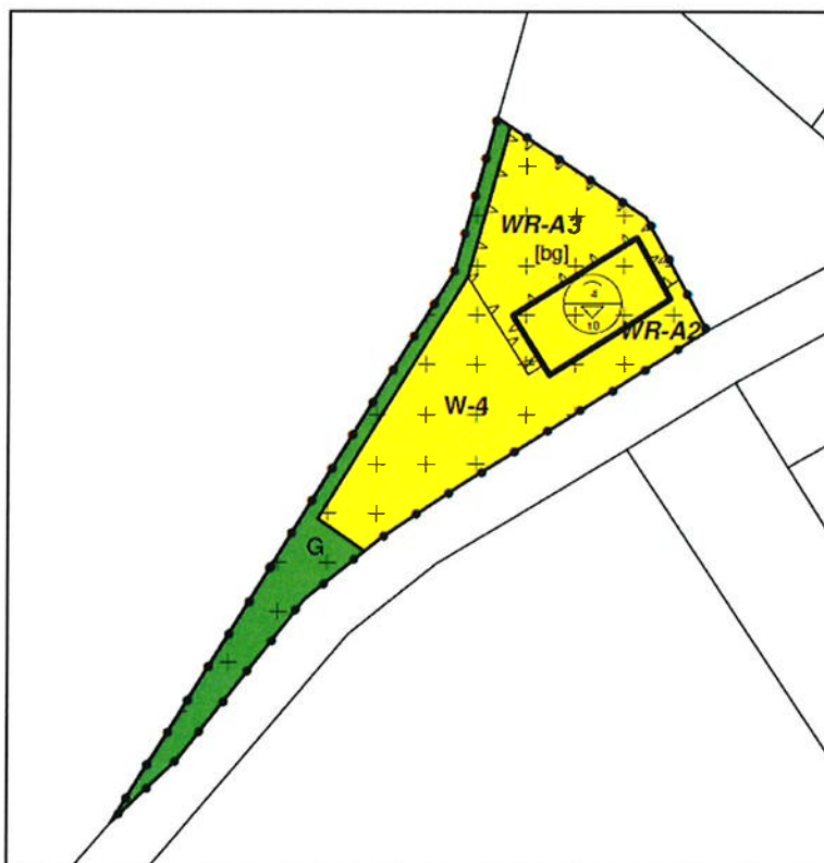
Figuur 1. Plangebied "Heers ong. (naast nr. 30)"

In onderstaande figuur is de begrenzing van het plan opgenomen.