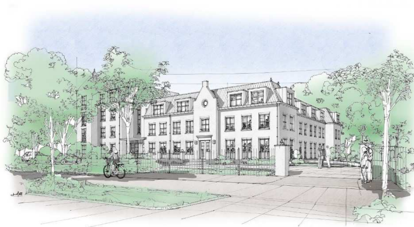
Afbeelding 2: Impressie voorzijde zorgvilla

Onderstaand twee afbeeldingen met impressies van de nieuwe situatie.