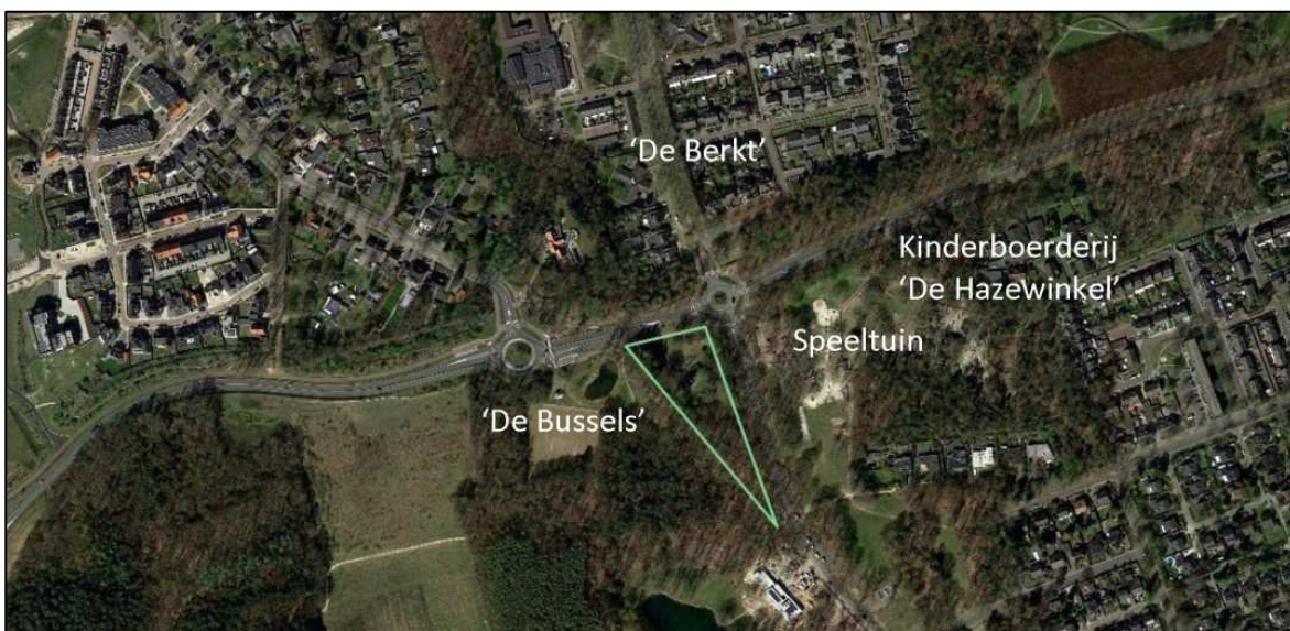
Afbeelding 1: Ligging perceel Sint Janstraat 66

Onderstaand een luchtfoto van de ligging van het perceel.