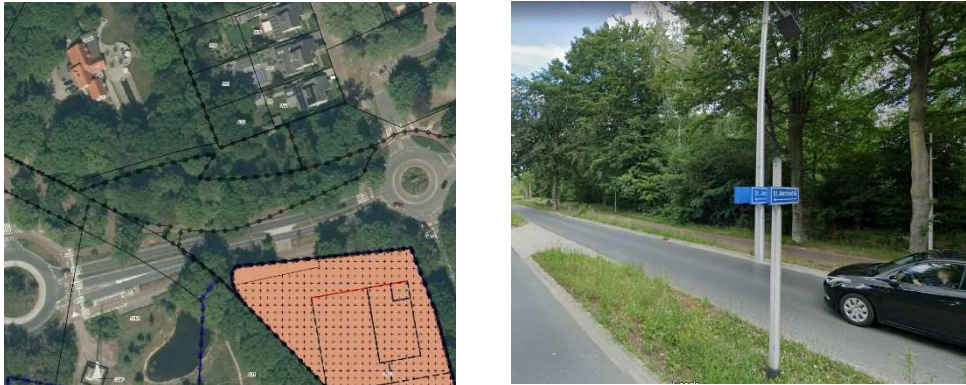
Afbeelding 3: luchtfoto perceel reclamant (links); zicht vanaf perceel Sint Janstraat 66 op perceel reclamant (rechts)

indiener bedraagt circa 96 meter en tot de woning circa 150 meter. Gelet op de relatief grote afstand tussen de zorgvilla en het perceel van indiener, in combinatie met de hoge bomen gelegen tussen de zorgvilla en de woning van indiener (zie de foto's in afbeelding 3) kunnen details vanaf de zorgvilla in de tuin en in de woning niet of niet goed worden waargenomen. In de winter zal door het bladverlies van de bomen het zicht op de woning/tuin wellicht iets groter zijn. Echter, dan zal er nog een zekere mate van beschutting zijn en blijft er op kortere afstand van het perceel en woning de inkijk vanaf de openbare weg en ruimte bestaan. Door de beoogde ontwikkeling zal dan ook geen significante verdergaande inbreuk op de privacy van indiener ontstaan.