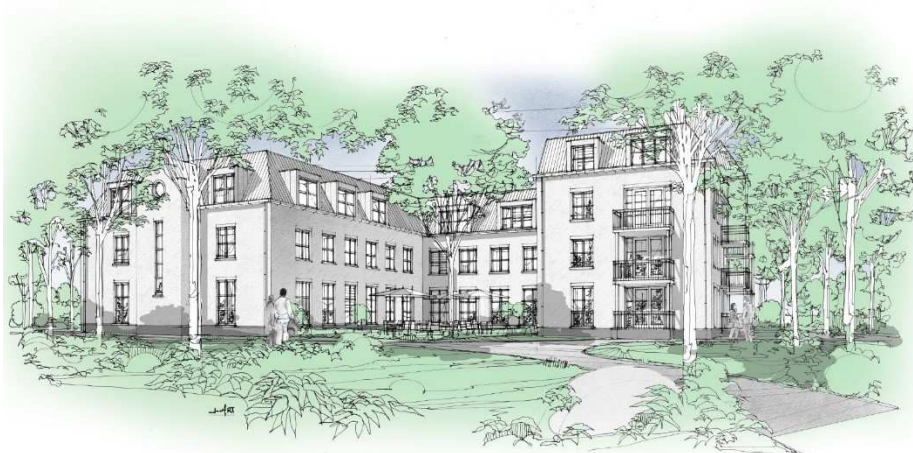
Afbeelding 3: Impressie achterzijde zorgvilla

Om deze ontwikkeling mogelijk te maken, is een bestemmingsplan opgesteld. Het ontwerpbestemmingsplan heeft van vrijdag 11 november tot en met donderdag 22 december 2022 ter inzage gelegen. Er is in deze periode 1 zienswijze ingediend. Uw raad is bevoegd het bestemmingsplan vast te stellen en te oordelen over de ingediende zienswijze.