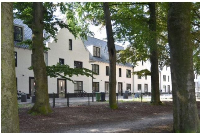
Referentiebeelden traditionele architectuur