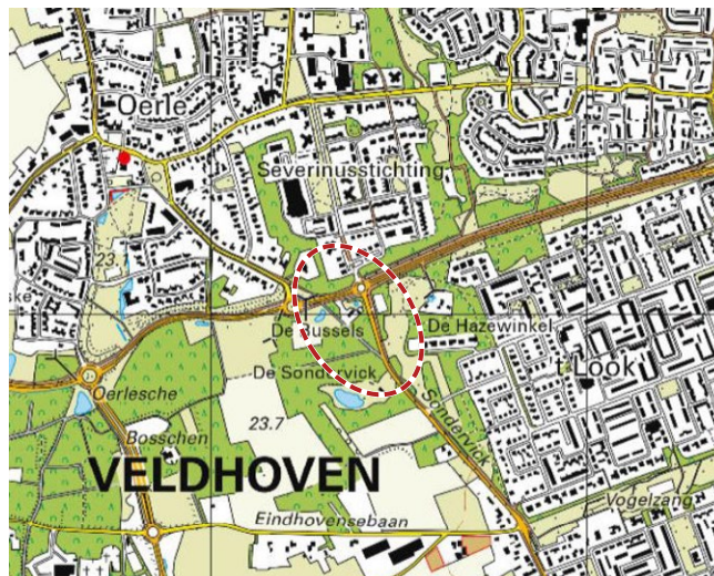
Topografische kaart

Met het vastleggen van een 'spelregelset' wordt beoogd ruimtelijke kwaliteit te garanderen, zowel binnen de locatie als in relatie zijn omgeving. Het voorliggende document vormt een aanvulling op het ambitiesdocument "Samen voor ruimtelijke kwaliteit" van de gemeente Veldhoven en zal samen met het bestemmingsplan voor de betreffende locatie worden vastgesteld.