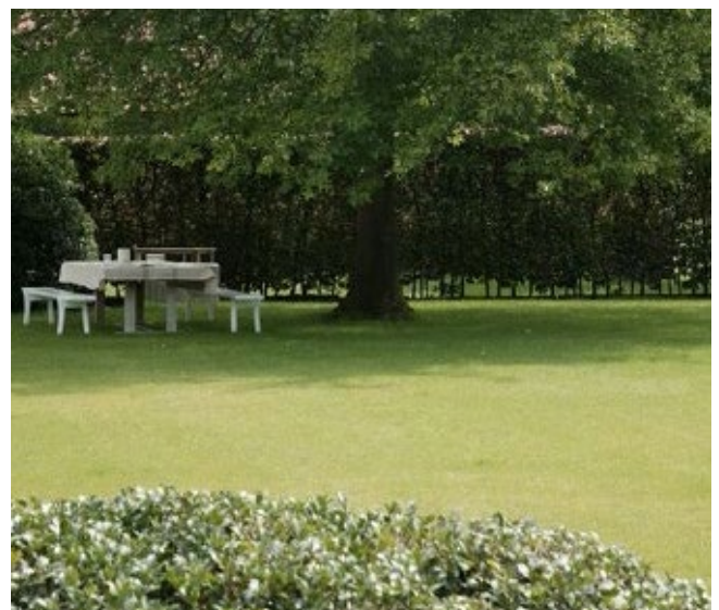
Referentiebeelden duurzame en groene inrichting