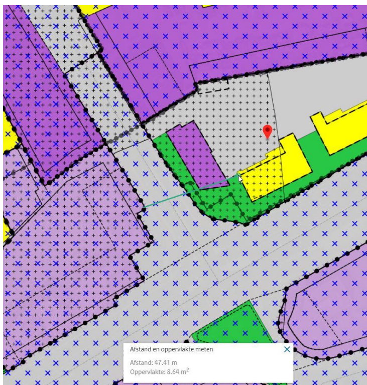
Afbeelding 2: afstand bedrijfsbestemming - woonbestemming

Wordt de kortste afstand gemeten vanaf de grens van de bedrijfsbestemming tot aan de bestemming 'wonen', dan bedraagt deze iets minder dan 50 meter, zie afbeelding 2.