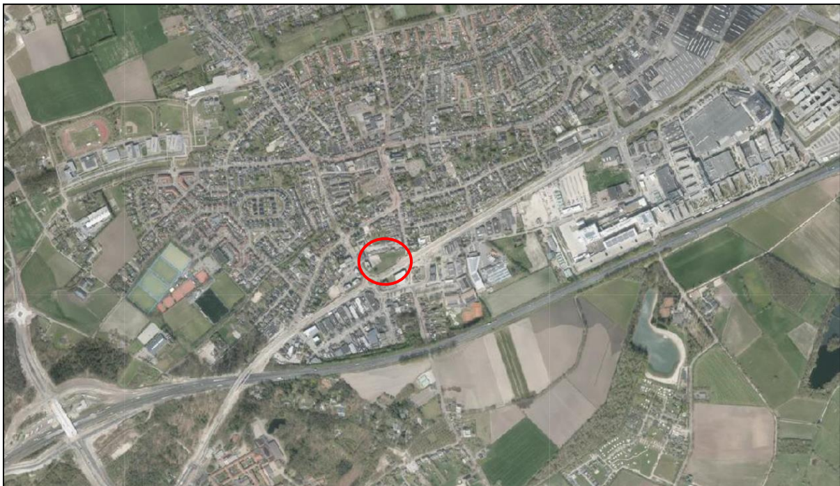
Figuur 1: Ligging plangebied (rood omcirkeld)

Het plangebied is tevens gelegen nabij het centrum van Veldhoven-dorp, één van de 4 oude kerkdorpen waaruit de gemeente Veldhoven is ontstaan. Figuur 1 en 2 geven de ligging van het plangebied weer.