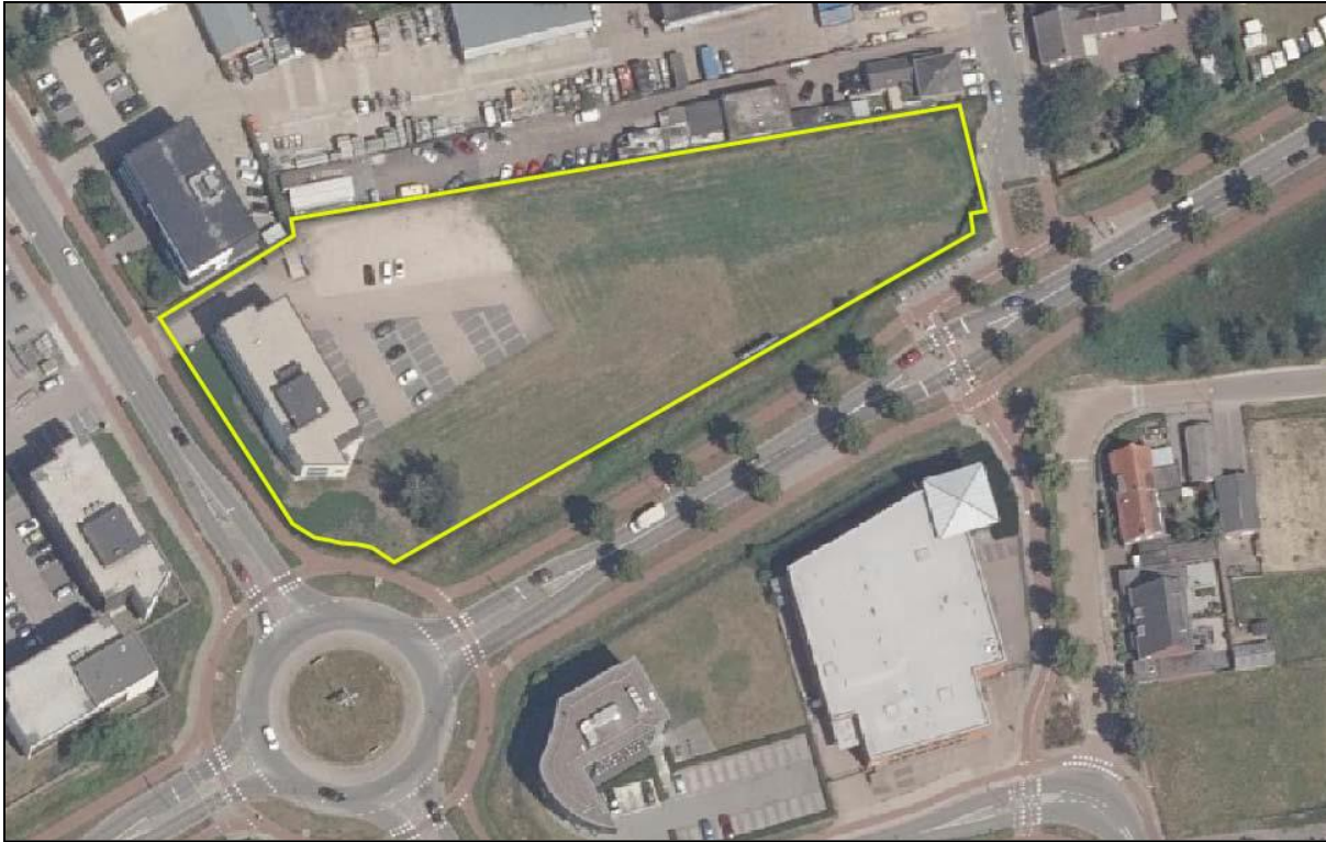
Figuur 2: Ligging plangebied (geel omlijnd)

Het plangebied is in de huidige situatie grotendeels onbebouwd. Het plangebied ligt op een maaiveldhoogte van circa 21,5 m +NAP.