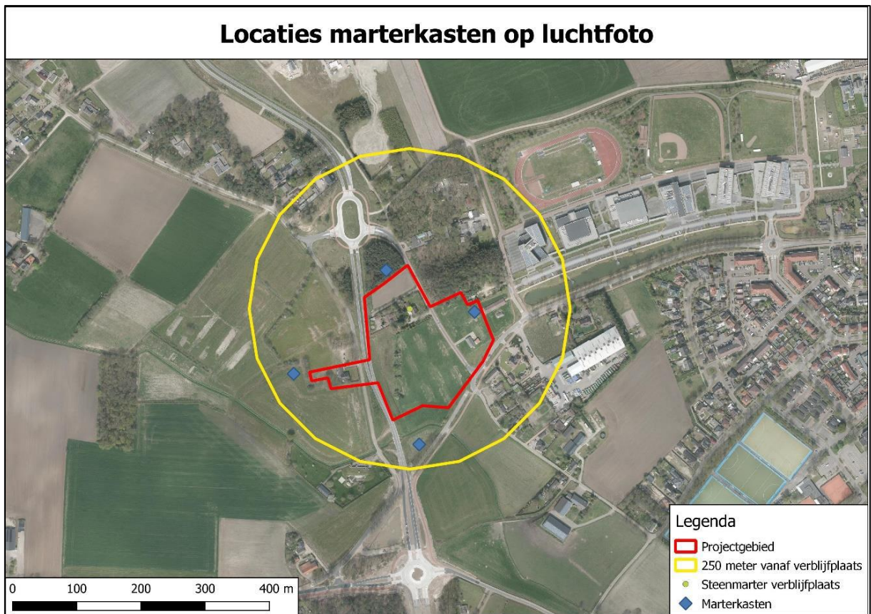
Figuur 2. Locaties van de voorzieningen voor de steenmarter.