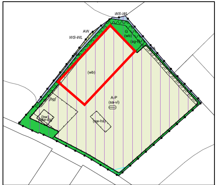
Afbeelding 2: Aangepaste ligging van de aanduiding waterberging (rood omlijnd)

b. Het waterschap geeft aan dat artikel 14.2 (voorwaardelijke verplichting waterberging) geen rekening houdt met eventuele toekomstige wijzigingen in beleid van gemeente of waterschap. Het waterschap verzoekt daarom om artikel 14.2 van de regels te vervangen door de volgende tekst: