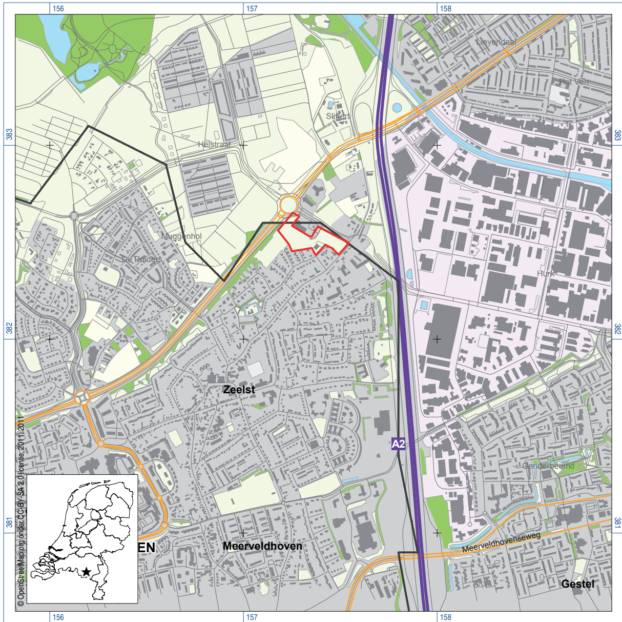
Figuur 1. De ligging van het onderzoeksgebied (rood); inzet: ligging in Nederland (ster).

Plangebied Heistraat/Slot Oost, gemeente Veldhoven Archeologisch vooronderzoek: een proefsleuvenonderzoek