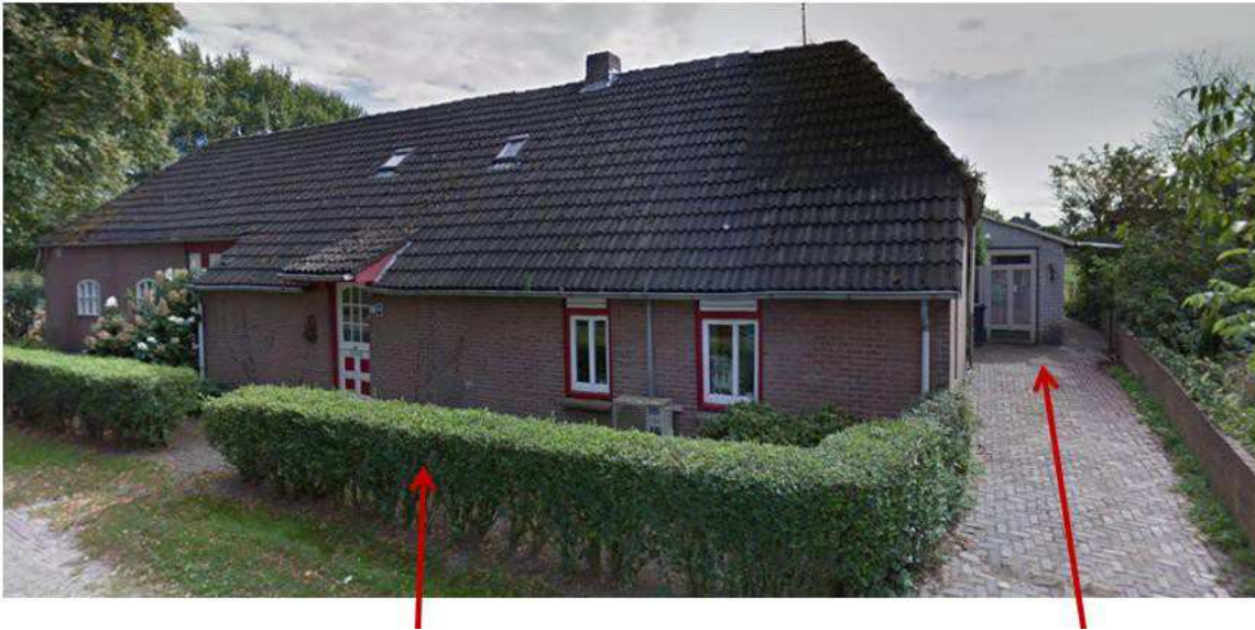
Afbeelding: foto bestaande woning Grote Vliet 19, met aan de zijkant de bestaande woning Grote Vliet 19a.