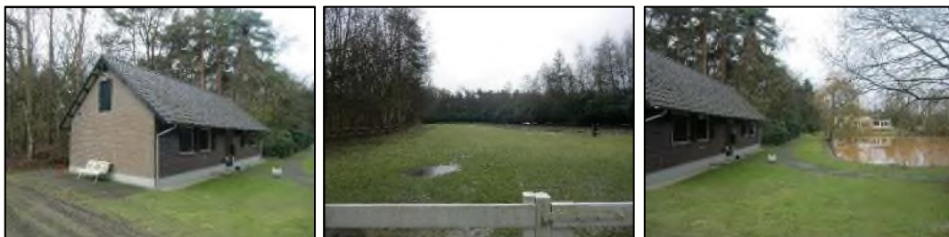
Figuur 4: sfeerimpressie landgoed

Het bijgebouw (inclusief dakoverstek) heeft een oppervlakte van circa 150 m 2 met een goot- en bouwhoogte van respectievelijk 2,5 en 4,5 meter. De centrale situering op het bosrijke perceel van ruim 4,4 hectare betekent dat het bijgebouw volledig is ingepast in de omgeving. De positionering van het bijgebouw is zodanig dat er een duidelijke relatie (zichtlijn) is met het landhuis alsmede de paardenweide op het oostelijk deel van het perceel.