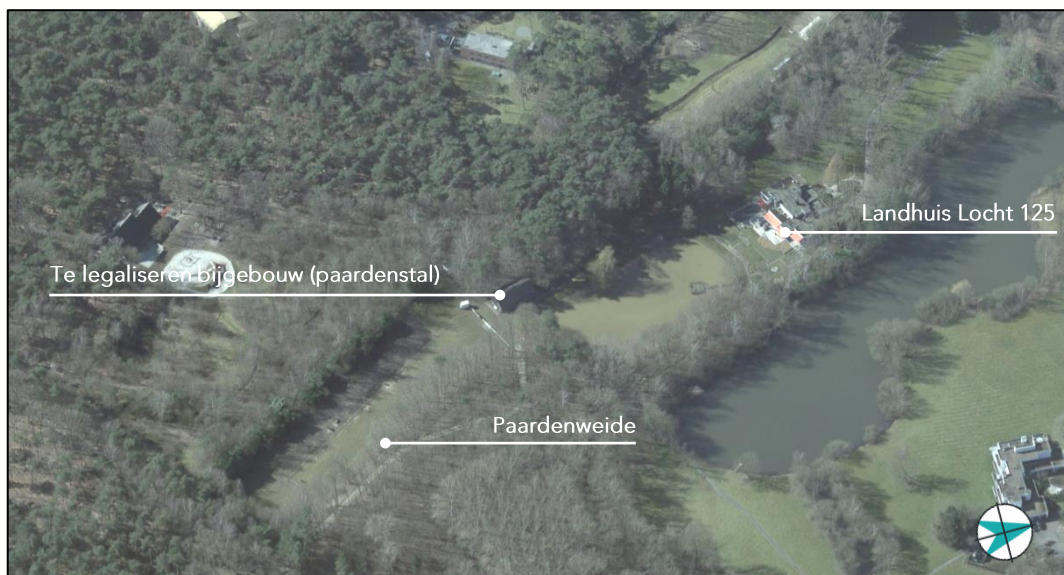
Figuur 3: vogelvlucht Locht 125

Het plangebied bevindt zich in het buitengebied van de gemeente Veldhoven aan de zuidwestkant van de kern van Veldhoven. In een landgoedachtige setting bevindt zich op het perceel aan de Locht 125 het desbetreffende bijgebouw, ten behoeve van een hobbymatig gebruik als paardenstal. Het bijgebouw dateert uit 2000 en is toentertijd gerealiseerd voor de te verplaatsen paarden van het perceel op de Locht (ter hoogte van de Plank in Veldhoven) in verband met grondverwerving op de kruising van de Kempenbaan en de verlengde Plank. Voor het onderkomen van de paarden werd een destijds aanwezige kooi en ren voor fazanten gesloopt.