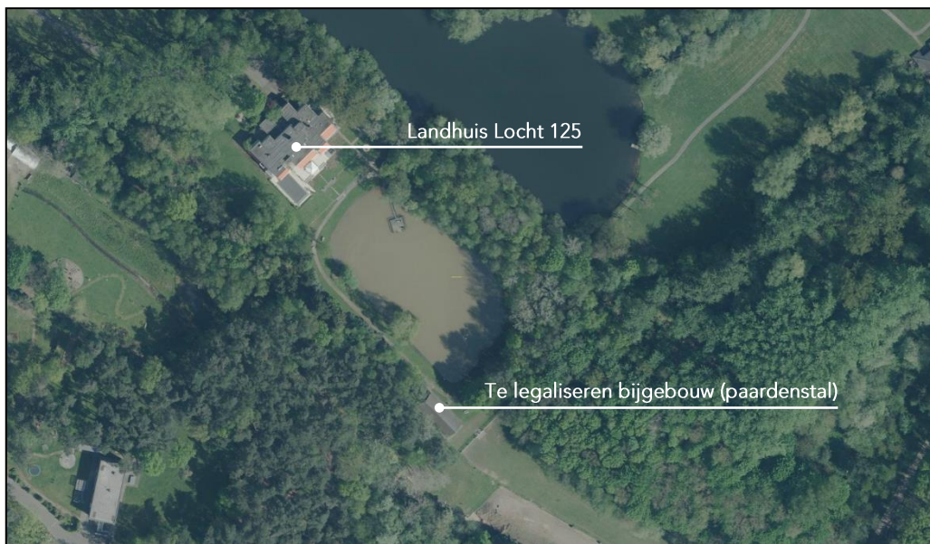
Figuur 2: situering Landgoed Locht 125, Veldhoven

Het plangebied bevindt zich in het buitengebied van de gemeente Veldhoven aan de zuidwestkant van de kern van Veldhoven. In een landgoedachtige setting bevindt zich op het perceel aan de Locht 125 het desbetreffende bijgebouw, in gebruik als paardenstal. Een gedeelte van het bijgebouw, met een omvang van circa 90 m 2 , is gesitueerd binnen het Natuurnetwerk Brabant. De totale oppervlakte van het bijgebouw (inclusief dakoverstek) bedraagt circa 150 m 2 en is gesitueerd op het perceel kadastraal bekend als gemeente Veldhoven, sectie B, nummer 3153.