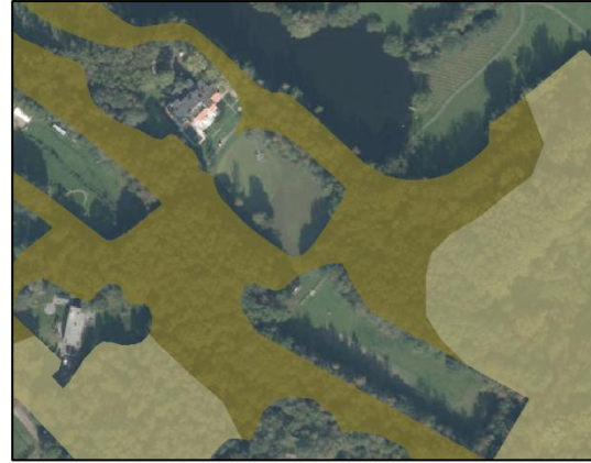
Figuur 11: uitsnede beheertypekaart natuurbeheerplan 2017