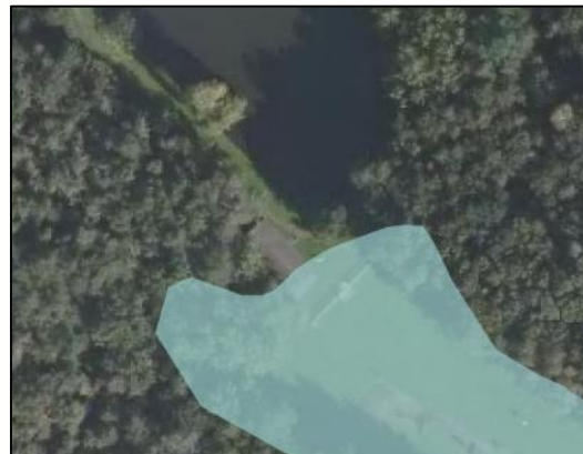
Figuur 8: Groenblauwe mantel (VR Noord-Brabant)

Het Natuurnetwerk Brabant (NNB) is een samenhangend netwerk van natuurgebieden en landbouwgebieden met natuurwaarden van (inter-)nationaal belang. Conform artikel 5.5 van de Verordening Ruimte kunnen Gedeputeerde Staten de begrenzing van het Natuur Netwerk Brabant op verzoek van de gemeente wijzigen ten behoeve van een individuele kleinschalige ingreep, mits voldaan wordt aan de wijzigingsvoorwaarden.