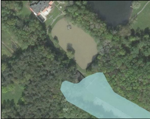
Figuur 9: bestaande begrenzing 'Groenblauwe mantel'