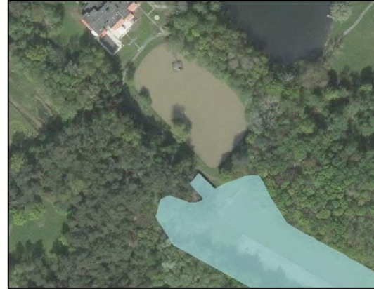
Figuur 10: herbegrenzing 'Groenblauwe mantel'

Er is gekozen om de structuur 'Groenblauwe mantel' toe te voegen omdat dit de structuur betreft die reeds voor de paardenweide op het landgoed van Locht 125 van toepassing is. Op deze manier ontstaat een aaneengesloten structuur en is de onderlinge relatie duidelijk herkenbaar.