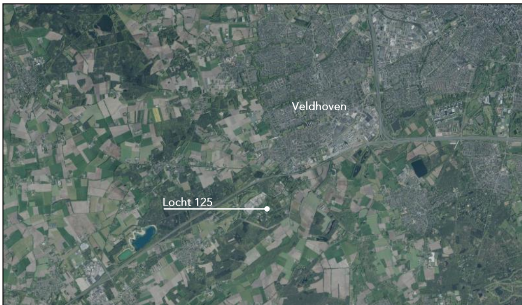
figuur 1: ligging plangebied binnen de gemeente Veldhoven

Via de onderhavige bestemmingsplanprocedure worden de gronden en bebouwing voorzien van een passend juridisch planologisch kader.