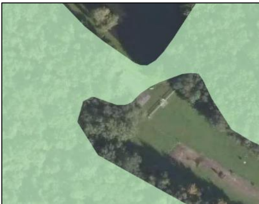
Figuur 7: Natuurnetwerk Brabant (VR Noord-Brabant)

Op de kaarten behorende bij de Verordening Ruimte is het bestaande bijgebouw (paardenstal) voor het merendeel gelegen in het 'Natuurnetwerk Brabant' en deels in de 'Groenblauwe mantel'. In het geval dat meerdere bepalingen van de verordening gelijktijdig van toepassing zijn geldt de meest beperkende bepaling, tenzij uitdrukkelijk anders is bepaald. Er wordt daarom in het onderhavig bestemmingsplan alleen nader ingegaan op de relevante aspecten ten aanzien van de gewenste herbegrenzing van het Natuurnetwerk Brabant.