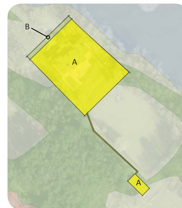
Toekomstige juridisch-planologische situatie