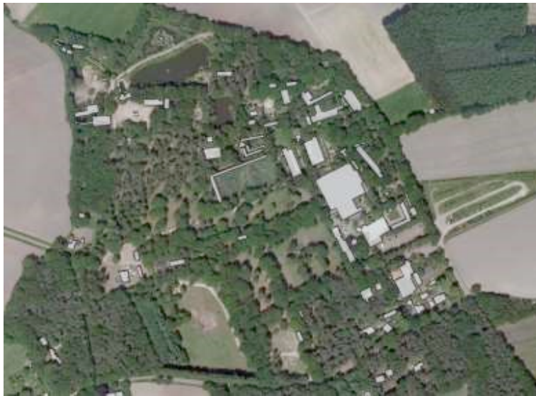
Figuur 2 Toekomstige inrichting (links) en huidige inrichting (boven rechts en onder)