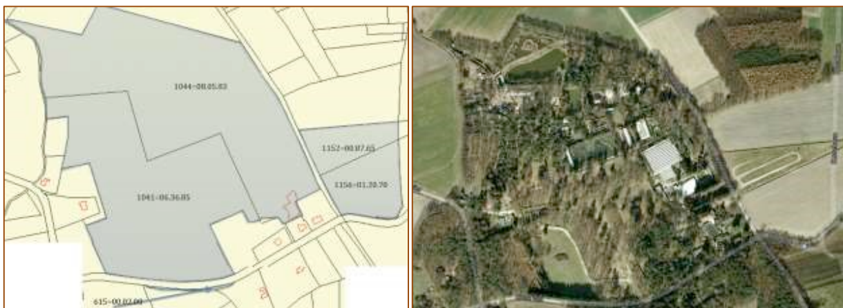
Figuur 1. Huidige eigendommen en luchtfoto