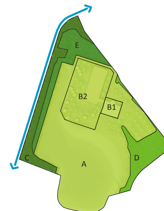
Toekomstige juridisch-planologische situatie