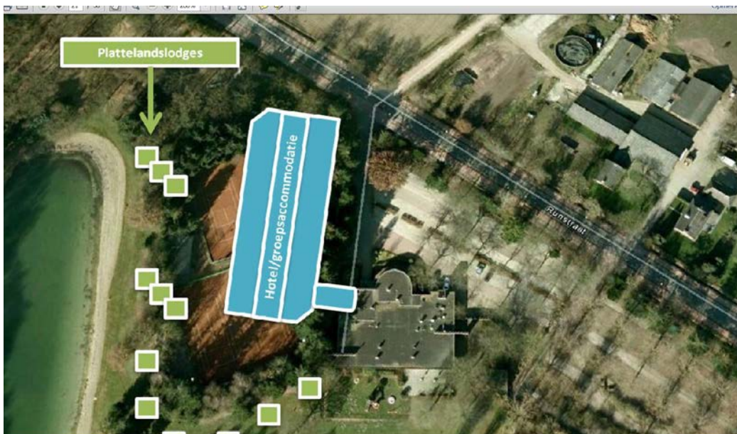
Afb. 1. Plangebied Runstraat 40 - Witven, gewenste situatie.